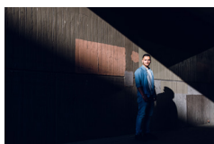
Civo 36 Kreuzberg Januar 2020

Mit ihren Bildern möchte die Fotografin die Wichtigkeit und Notwendigkeit von Sozialarbeit als Prozess der Identitätsbildung von Jugendlichen sichtbar machen. Hierbei ist ihr wichtig, dass die Jugendlichen selbst im Fokus stehen. Die Bildauswahl zeigt starke und selbstbewusste Persönlichkeiten, die durch den Zugang zu einem offenen Raum des kreativen Austauschs befähigt wurden ihr künstlerisches Potenzial zu entfalten.