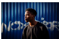
Prosper Summer Jam Steinhaus Lichtenberg Juli 2022