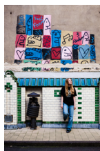
Emmo Kreuzberg Juli 2024